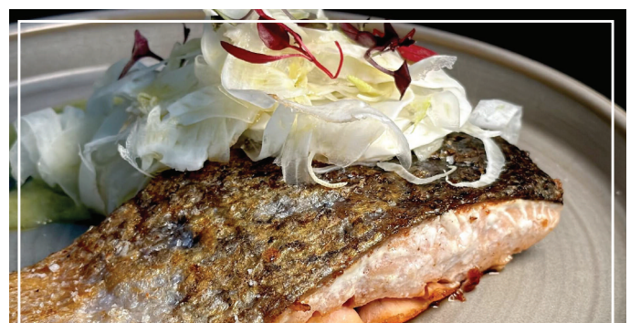
★ SALMÓ A LA PLANXA 15.50 AMB AMANIDA DE CARBASSÓ, FONOLL I TOMÀQUET SEC AMB SALSÀ DE IOGURT