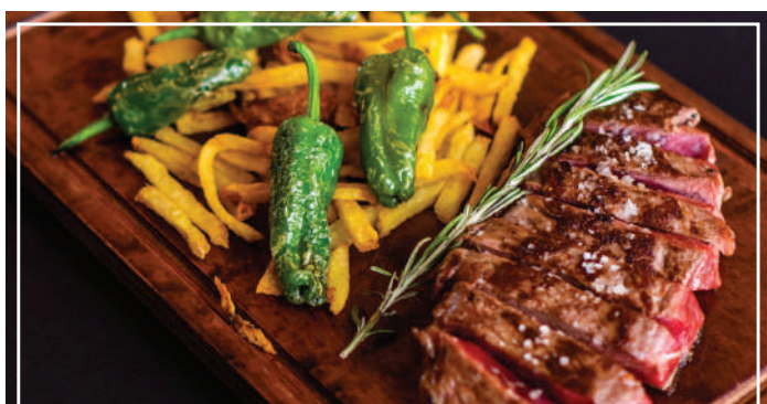
★ ENTRECOT DE VEDELLA 15.95 AL ROMANÍ AMB PATATES FREGIDES I PEBROTS DE PADRÓN