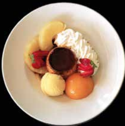
EL PIJAMA DEL PLA