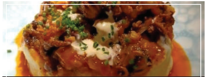
★ PULPITOS ENCEBOLLADOS 12.95 CON UN PUNTO PICANTE, PATATA Y ALLIOLI DE LIMÓN