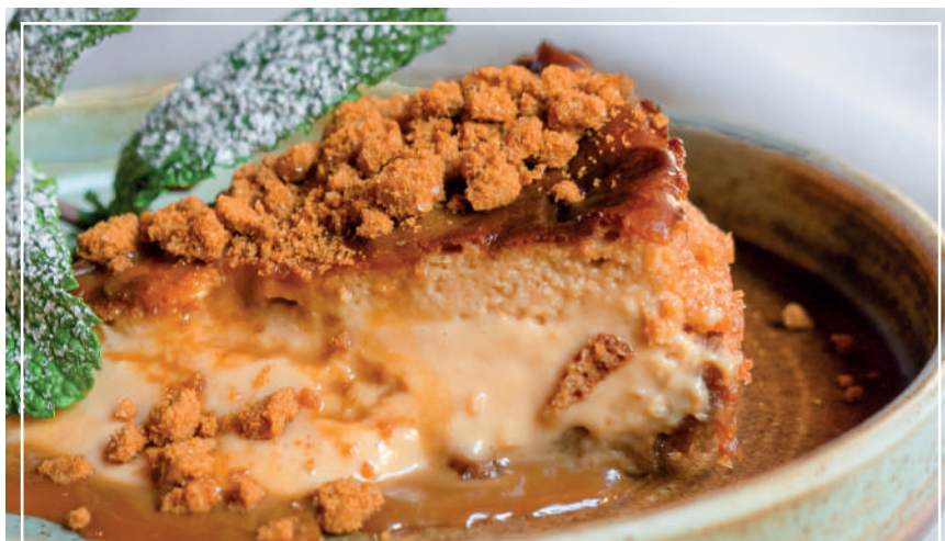
★ CHEESECAKE CREMOSO 5.50 DE DULCE DE LECHE CON GALLETA LOTUS