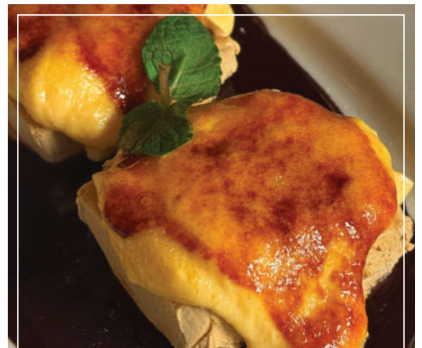
★ TIM BAON 4.75