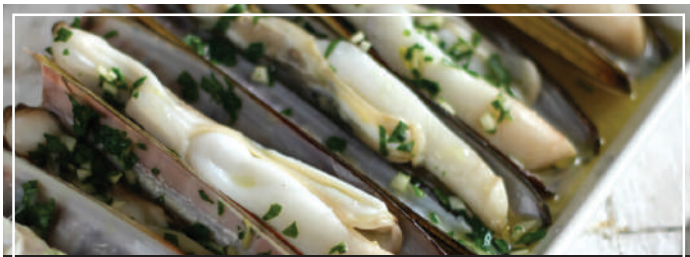
★ NAVAJAS 13.95 A LA PLANCHA CON SAL MALDON