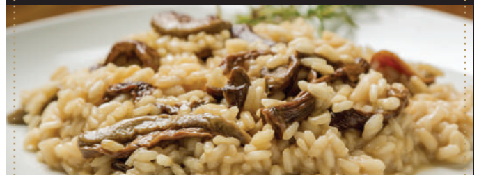
★ RISOTTO DE CEPES TRUFADO 12.85 CON NUBE DE PARMESANO Y PORTOBELLO